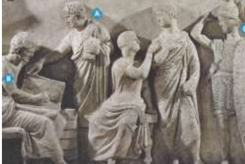
Bas relief, I er siècle avant J.-C., musée du Louvre, Paris.

Tous les cinq ans, deux magistrats, les censeurs, organisent le recensement des citoyens romains. Ces derniers sont répartis en cinq groupes selon leur fortune. Cette répartition sert de base pour le vote aux comices, le paiement de l'impôt et le service militaire (c). Un citoyen romain (A) déclare son état-civil à un greffier (B).