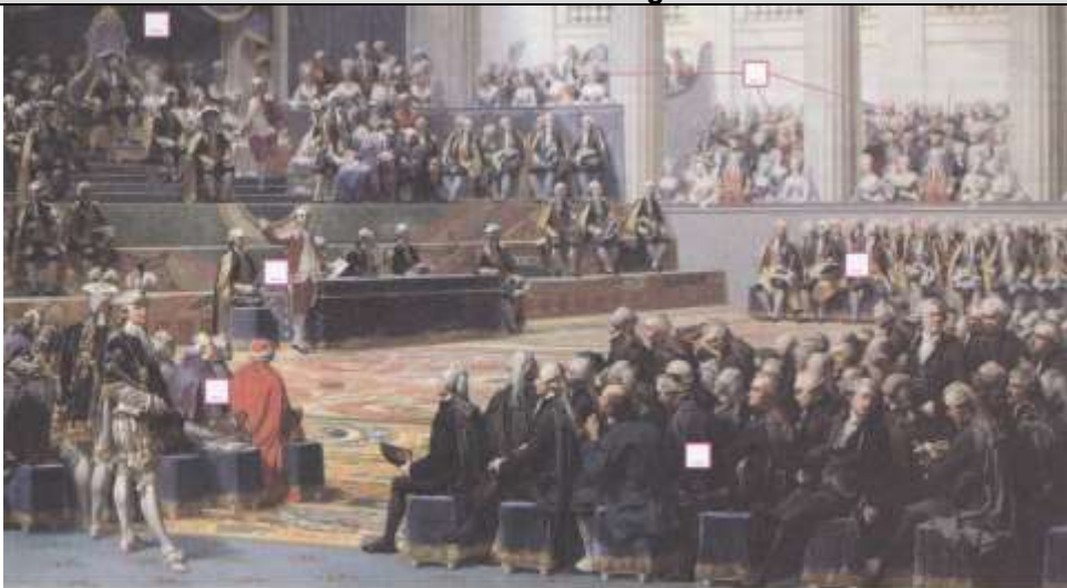
Reconstitution d'A. Couder, Musée de Versailles

13. Sur le document ci-dessus, écrivez la lettre correspondant aux éléments suivants :